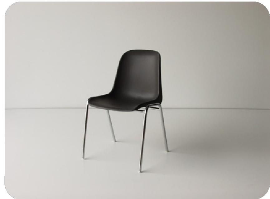
Καρέκλες χρώματος μαύρου, μεταλλικά πόδια με πλαστικό κάθισμα καλής κατασκευής.