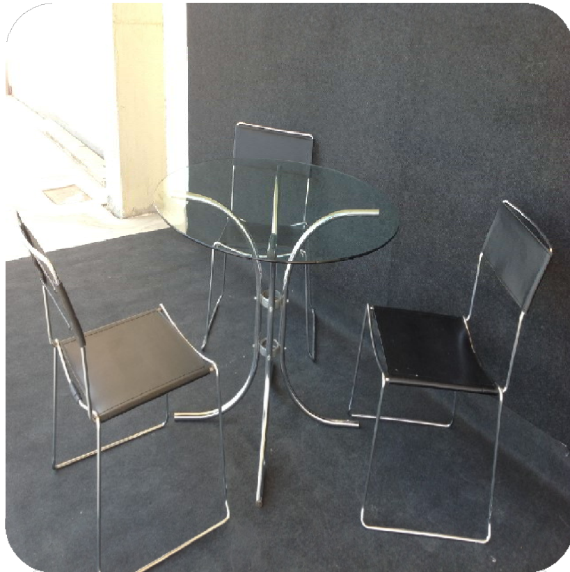
Τραπέζι στρογγυλό με γυάλινη επιφάνεια