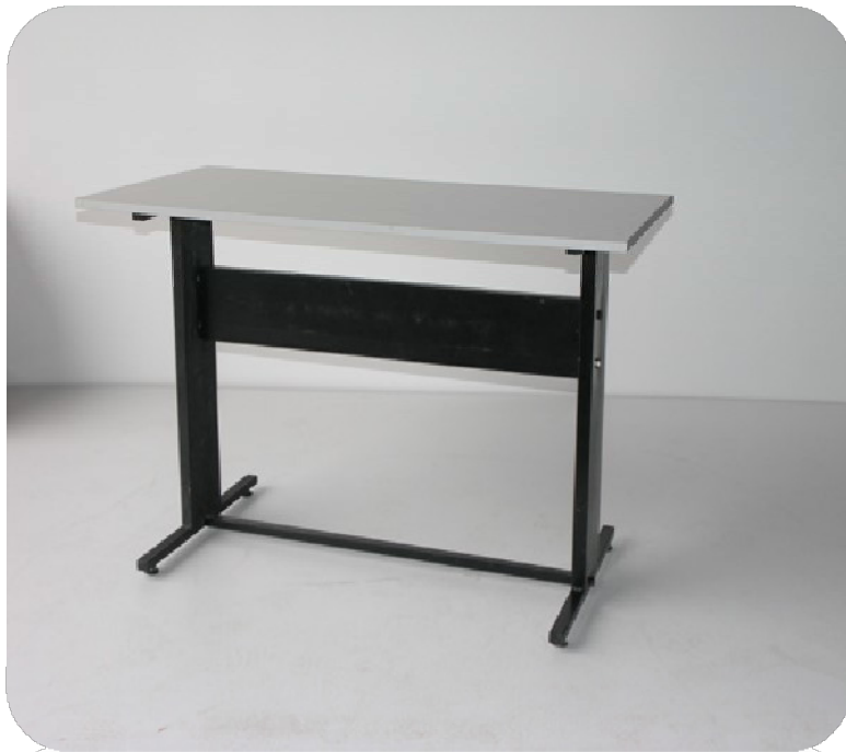
Γραφεία διαστάσεων 0,60μΧ1,20μΧ0,75μ από μεταλλικό σκελετό με καπάκι από μελαμίνη χρώματος γκρι.