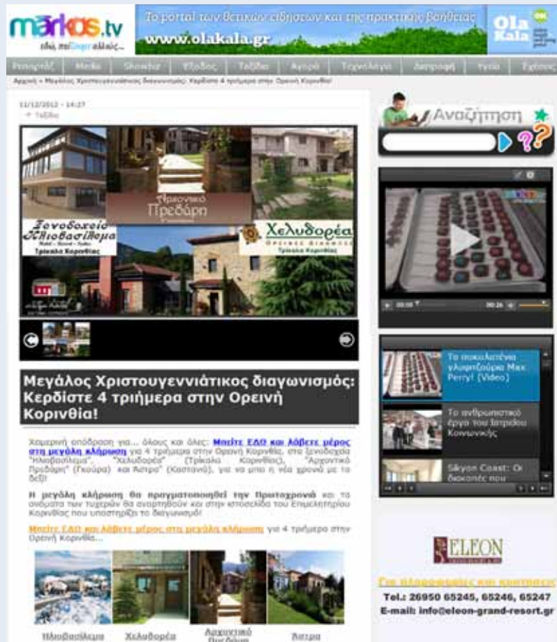
Χριστουγεννιάτικος Διαγωνισμός στο site markos.tv που έφτασε τις 3200 συμμετοχές!

Στο πλαίσιο της προβολής της Κορινθίας, της προώθησης των τουριστικών προορισμών της και την προσέλκυση επισκεπτών των τουριστικών επιχειρήσεων, το Επιμελητήριο Κορινθίας ανέλαβε σημαντικές πρωτοβουλίες το περασμένο τρίμηνο μερικές από τις οποίες είναι οι παρακάτω .