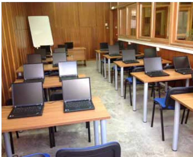
Η αίθουσα υπολογιστών του Κέντρου Επαγγελματικής Κατάρτισης του Επιμελητηρίου Κορινθίας.