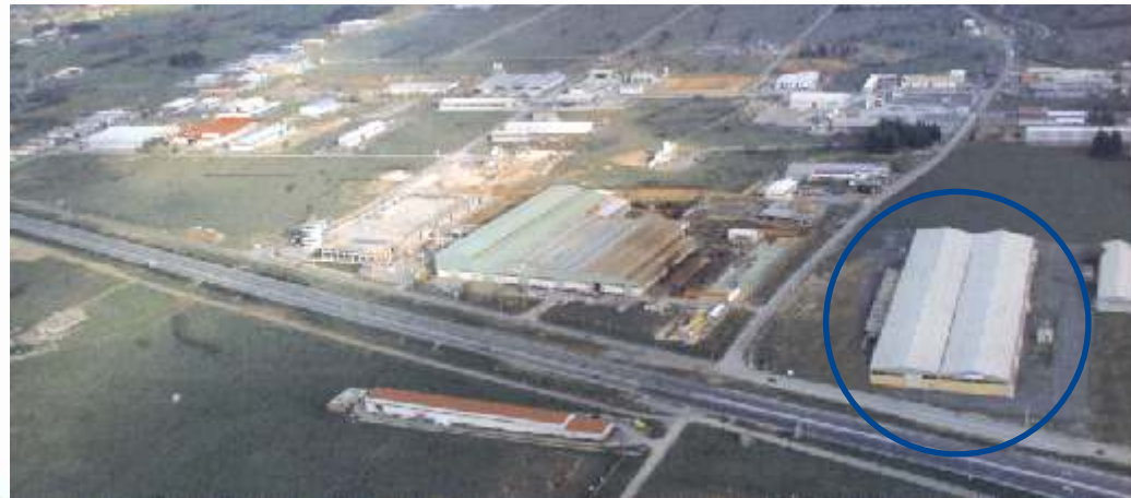
ΒΙ.ΠΕ. ΤΡΙΠΟΛΗΣ (ΕΙΣΟΔΟΣ): ΚΤΙΡΙΟ ΓΕΑ Α.Ε.